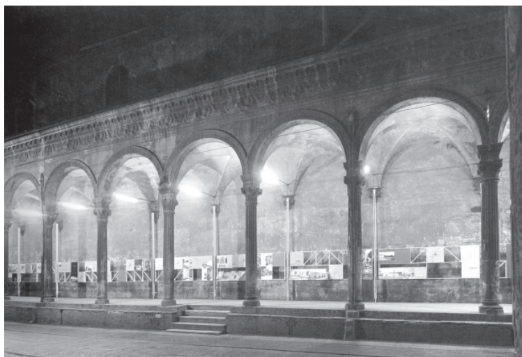
6 Exposición Dieci anni di architettura sacra bajo el pórtico renacentista de via Zamboni (Bologna, 1955).

Gl— Naturalmente, tras todo esto organizado por Trebbi debía haber una parte material. Los ponentes que se invitaron provenían de la exposición Dieci anni di architettura sacra in Italia 1945-1955 , que se había terminado poco antes. Estamos en 1955. En esos diez años se habían hecho muchas iglesias modernas, y el congreso contaba con esta documentación 9 .