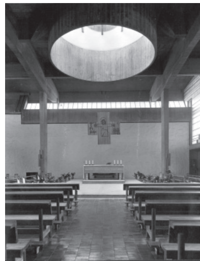
7 y 8 Glauco Gresleri, modelo de iglesia de vanguardia: iglesia parroquial de María Inmaculada (Bologna, 1956/58); izquierda, planta; derecha, interior. La cruz sobre el altar es obra de Giuliano Gresleri.

Gi— Pues me parecen muchas... Pero esa desafección primero, las diferencias luego y la guerra abierta al final, fueron las causas por las cuales Lercaro tuvo que abandonar la diócesis. Lercaro no fue rechazado por Roma, sino por intrigas locales 10 . En concreto, por los grandes cabildos de San Pietro y San Petronio, donde algunos personajes tenían una animadversión feroz hacia él. ¿Y por qué? Porque Lercaro los había destruido. Porque todas las obras, todas las decisiones sobre las grandes operaciones las tomaba él en persona.