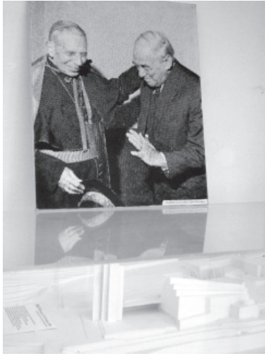
5 Fotografía del Cardenal Lercaro con Alvar Aalto, sobre la maqueta del conjunto parroquial de Nuestra Señora Asumpta que se encuentra en el interior de la propia iglesia, en Riola di Vergato (Bologna).

el espacio moderno, y el que sabe de arquitectura entiende el espacio moderno. El arte moderno, la arquitectura moderna, son difícilísimos de comprender. Y verdaderamente, sería muy presuntuoso por nuestra parte pensar que Lercaro entendía todo.