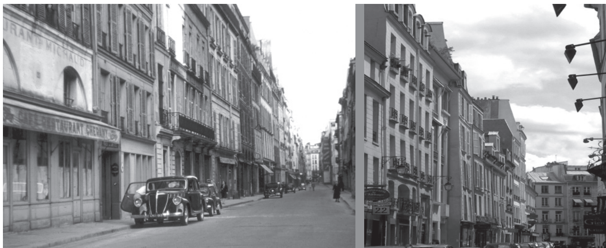
05 Dos imágenes de la rue Jacob: a la izquierda, el café-restaurant Cheramy (h. 1934); a la derecha, el edificio donde vivía Le Corbusier.

tomó su nombre del altar a Santiago elevado allí. En ella residieron personajes célebres: Wagner, Merimée, Colette o Hemingway. Sus edificios son de mediados del XVIII y comparten patios y traseras con Visconti, con tiendas de artesanos y grandes portones abiertos a patios adoquinados.