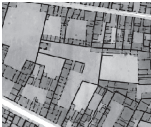
04 La manzana Visconti-Jacob en el catastro Verniquet (s. XVIII).

jarme cerca de mis negocios. He roto moralmente con la Rive Gauche 8 . En mayo, animando a su hermano a instalarse en París, le ofrece su apartamento en Jacob, porque —le indica— «yo me mudo al centro, a la otra orilla» 9 . Busca una situación ideal a dos pasos de su oficina, que le permitiera resolver la contradicción entre vivienda y trabajo. Pocos años después la opción cambia y es la Rive Gauche la seleccionada de forma definitiva.