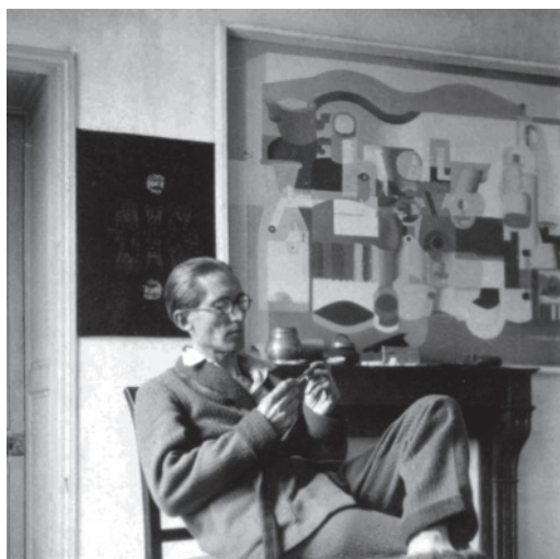
10 Le Corbusier en rue Jacob, h. 1920.