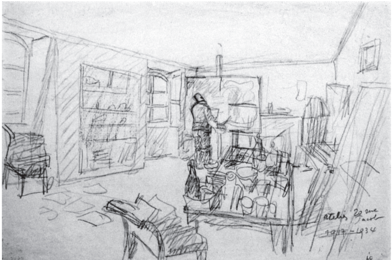
12 Le Corbusier en rue Jacob, dibujado por él mismo, h. 1934.

Mediante la fotografía, Brassáï analizó esta maison cachée corbuseriana en los momentos finales, observando cómo estaba todo tan sobrecargado de objetos, libros y papeles que no quedaba más que un pequeño sitio para escribir o dibujar 38 . Es el penúltimo testimonio del habitar y del hábitat en Jacob. El último es la imagen que el propio Le Corbusier dibuja de sí mismo, de espaldas, como despidiéndose, antes de abandonar Jacob 39 (Fig. 12). «Se pasa una página — escribe—. Termina un ciclo» 40 .