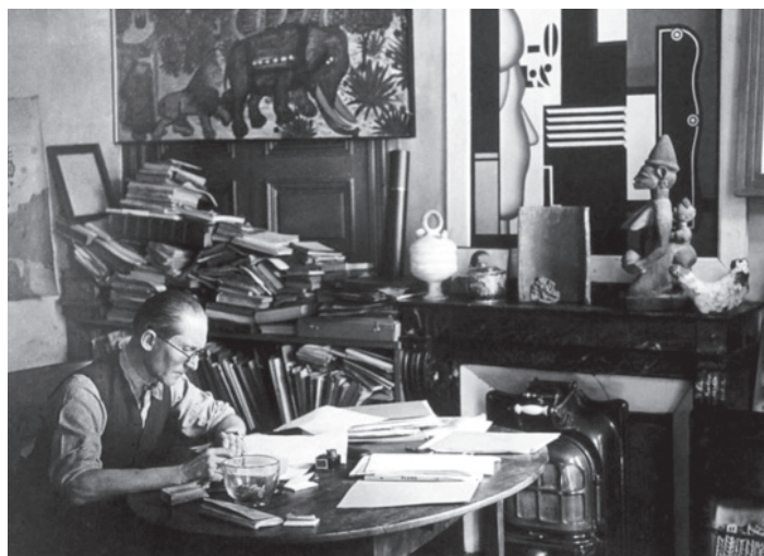
11 Le Corbusier en rue Jacob, fotografiado por Brassai hacia 1930.

cerca de mis negocios» 26 . Y en mayo, animando a su hermano a instalarse en París, dice: «Ya tienes un apartamento exquisito y prácticamente por casi nada aquí, en Jacob. Tú te quedarás con el apartamento. Yo me voy al centro, cerca de mis negocios, a la otra orilla» 27 .