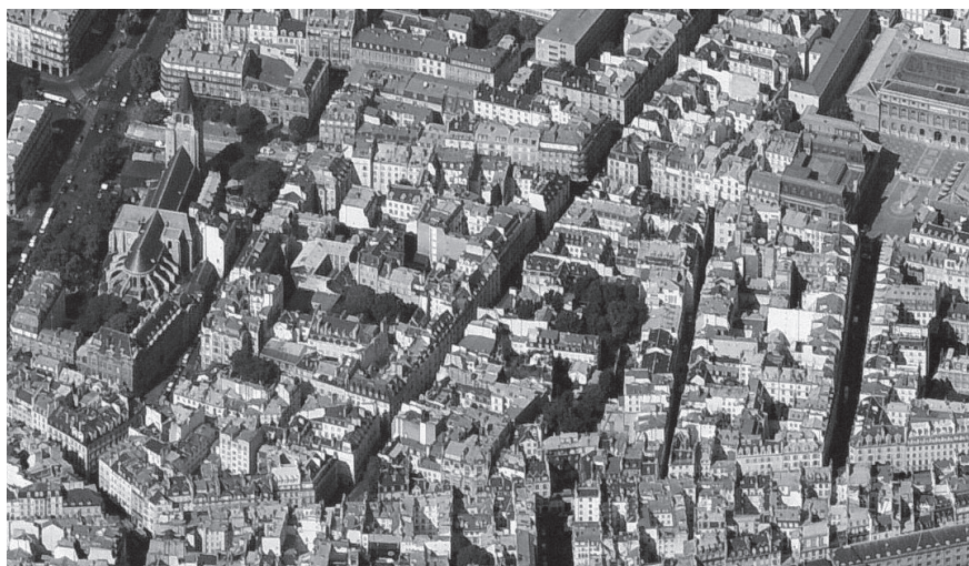
02 Foto aérea del barrio de Saint Germain des Près, donde se aprecia el espléndido jardín interior de la manzana Visconti-Jacob.