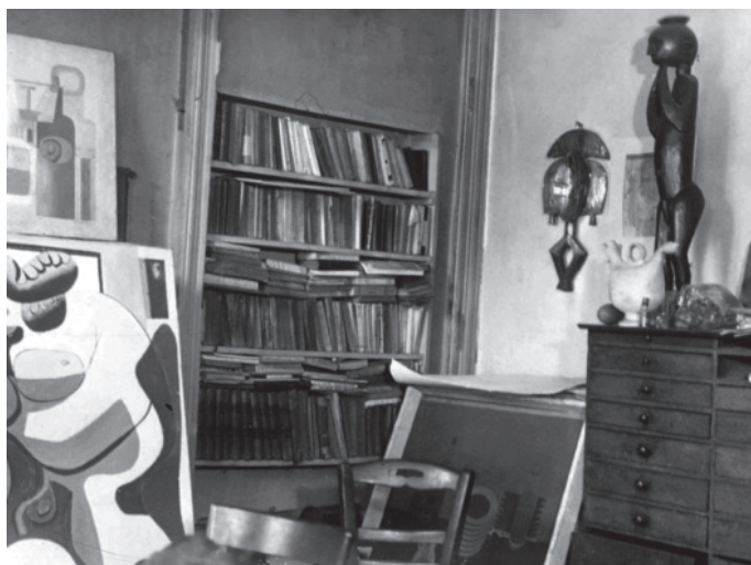
09 El atelier corbuseriano fotografiado hacia 1920.

Podemos, en efecto, distinguir varias etapas distintas de ese habitar. Cuando, temporalmente quizás, alquila el apartamento. Cuando, enfrascado en los negocios, lo habita solo de noche, planteándose, incluso, cederlo y mudarse a la Rive Droite . Cuando, instalado en él su hermano, y trasladado al piso inferior, pasa a establecer una relación de equilibrio habitacional. Y, sobre todo, cuando aparece Yvonne que, instalada provisionalmente primero y luego de modo cada vez más estable en el apartamento, altera por completo su modo de vida: su habitar, en unos años felices, en que la valoración de ese hábitat es netamente positiva. Y, por último, en los años finales, cuando se plantea un hábitat nuevo y más amplio, que se confirma en Porte Molitor. A cada una de estas etapas vamos a dedicar una reflexión.