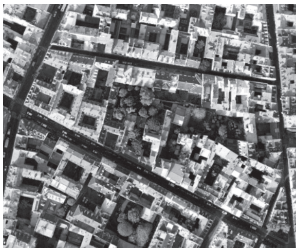
03 Ortofoto de la manzana Visconti-Jacob.