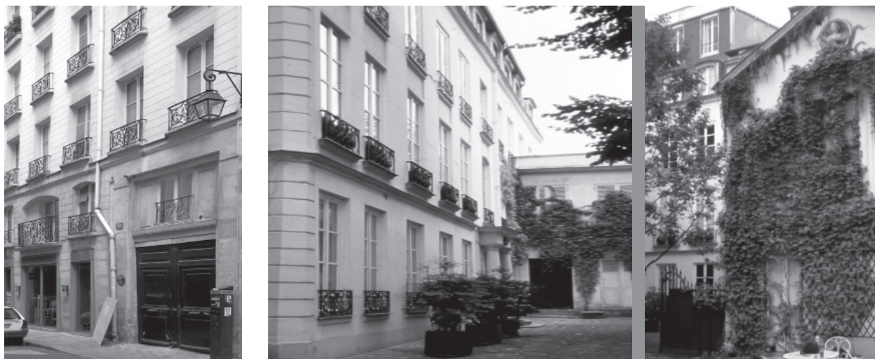
06 Portal de entrada al edificio.