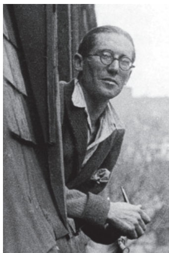
01 Le Corbusier en rue Jacob, h. 1920.