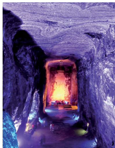
06 Alfredo Rodríguez Orgaz, Catedral de la Sal, Zipaquirá (Colombia), 1950/54

colgados en la web y publicados en varios libros. Pese a ello, no olvidé el carácter primigenio del edificio. Por ello, sí hay un contenido (ligeramente velado u oculto) de significación religiosa. No olvidemos que yo también soy católico. Aunque no hay que dejar de lado todo lo que te indico acerca del edificio —su funcionalidad, la desacralización, el paso del reino de la gracia al reino de la cultura, etc.—, hay conceptos religiosos o trascendentes que sí están presentes en la obra. El nacimiento y la muerte. El génesis. El árbol de la vida. Los pecados capitales. Los signos zodiacales. La bóveda celeste. El bien y el mal. La luz y las tinieblas, el Tótem, ídolo o DIOS que hay descrito en la cabecera (en líneas blancas): JESÚS. Junto a él, la imagen de un san Juan Bautista desrealizada [sic] junto a una mancha azul que simboliza el agua, la purificación, el inicio...» 9 .