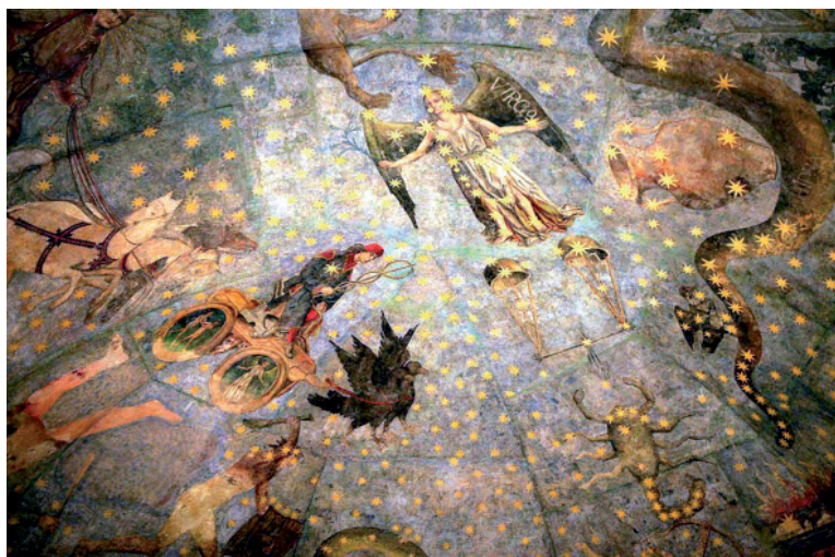
13 Fernando Gallego, El Cielo de Salamanca , Salamanca, 1481/86; detalle