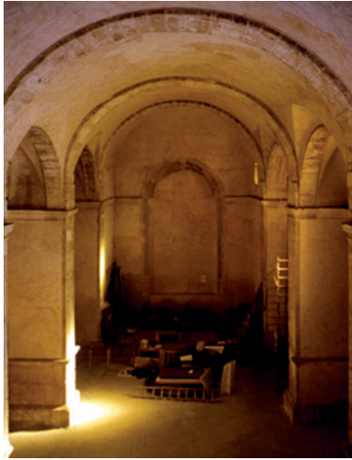
03 Interior del edificio al comienzo de las obras, 1998