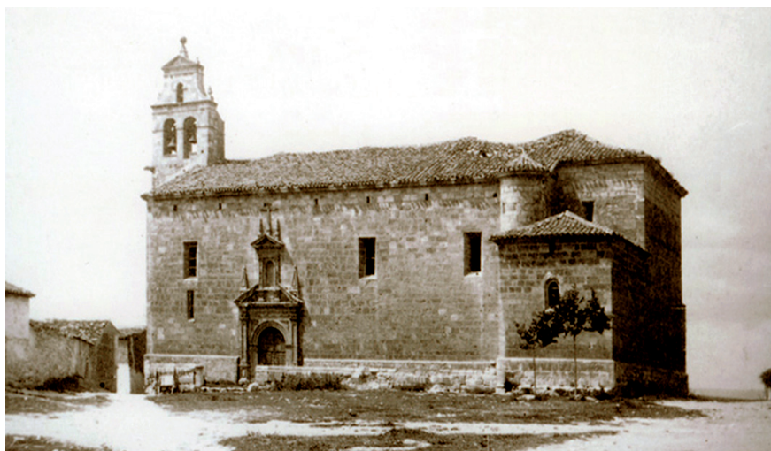
02 Estado de la antigua iglesia de san Juan Bautista, Alarcón (Cuenca), a finales del siglo XIX

mordió el anzuelo, y la familia propietaria de la famosa marca de agua embotellada, testigo del desafío, ofreció la primera ayuda. Luego vendría el permiso del obispado, el patrocinio de la UNESCO y las ayudas económicas necesarias para una obra de proporciones excesivas para un pueblo de doscientos habitantes. Otros pintores se interesaron, cedieron cuadros para subastas benéficas y se constituyó una asociación. Y así, del lance del sabio párroco al inexperto pintor, surgió la aventura de las pinturas murales de Alarcón.