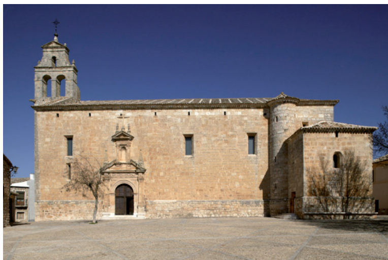
07 Vista general de la antigua iglesia al finalizar de las obras (2005); a la derecha, la antigua sacristía, donde se sitúa la entrada

Con todo, nos podríamos preguntar si ese propósito profanador se ha conseguido realmente. Algunos de los escritos sobre Alarcón así lo afirman. Pero desde nuestro punto de vista, la clarificación de este aspecto fundamental de la obra requiere un análisis un poco más detallado. En este momento sólo parece claro que la intervención de Mateo se sitúa en la línea de lo que Juan Pablo II recordaba en su Carta a los artistas : «Nadie mejor que vosotros, artistas, geniales constructores de belleza, puede intuir algo del pathos con el que Dios, en el alba de la creación, contempló la obra de sus manos» 11 . Analicemos, pues, brevemente, las pinturas.