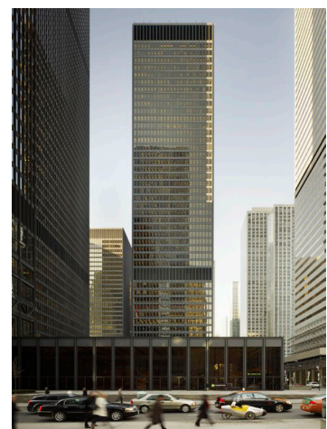
Fig.03. Mies van der Rohe. Toronto Dominion Center. 1969.

While Aries-Mies could live in an age in which it was legitimate to think that “architecture is over that notion of culture with c small letter” 12 , the merciless critique of Cooper seems again to advance a decade to the new claims of the participative urban planners and the urban commons. According to Cooper, the architect could not be anymore “out of the normal life that goes by between those walls” 13 . It is banned both “demolishing Paris” and the joy of having “a free and frank conversation between humans beings that are genius [that they considered themselves] gods” 14 . The current civil society demands the architect of the XXth Century to be part of the social space that he himself projects.