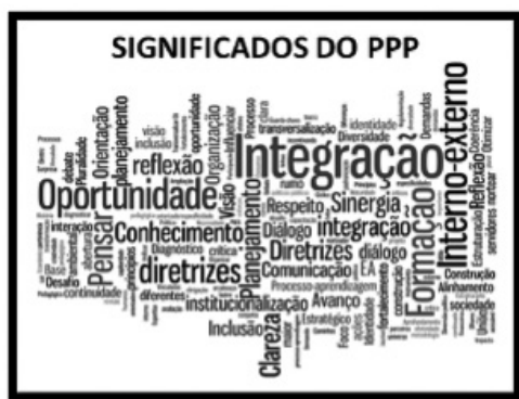
Figura 1. Palavras representativas dos significados do PPP do MMA e suas instituições vinculadas

Sendo a CISEA uma instância de governança, situada dentro do próprio MMA, deve funcionar como fórum de concertação dos processos educativos, consi-