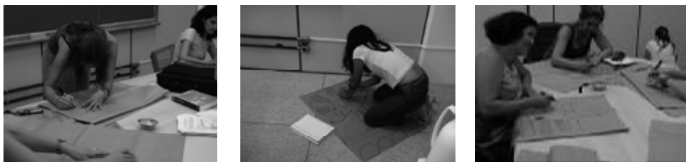
Figura 2. Elaboração de desenhos em "Visão do futuro de Palmas".