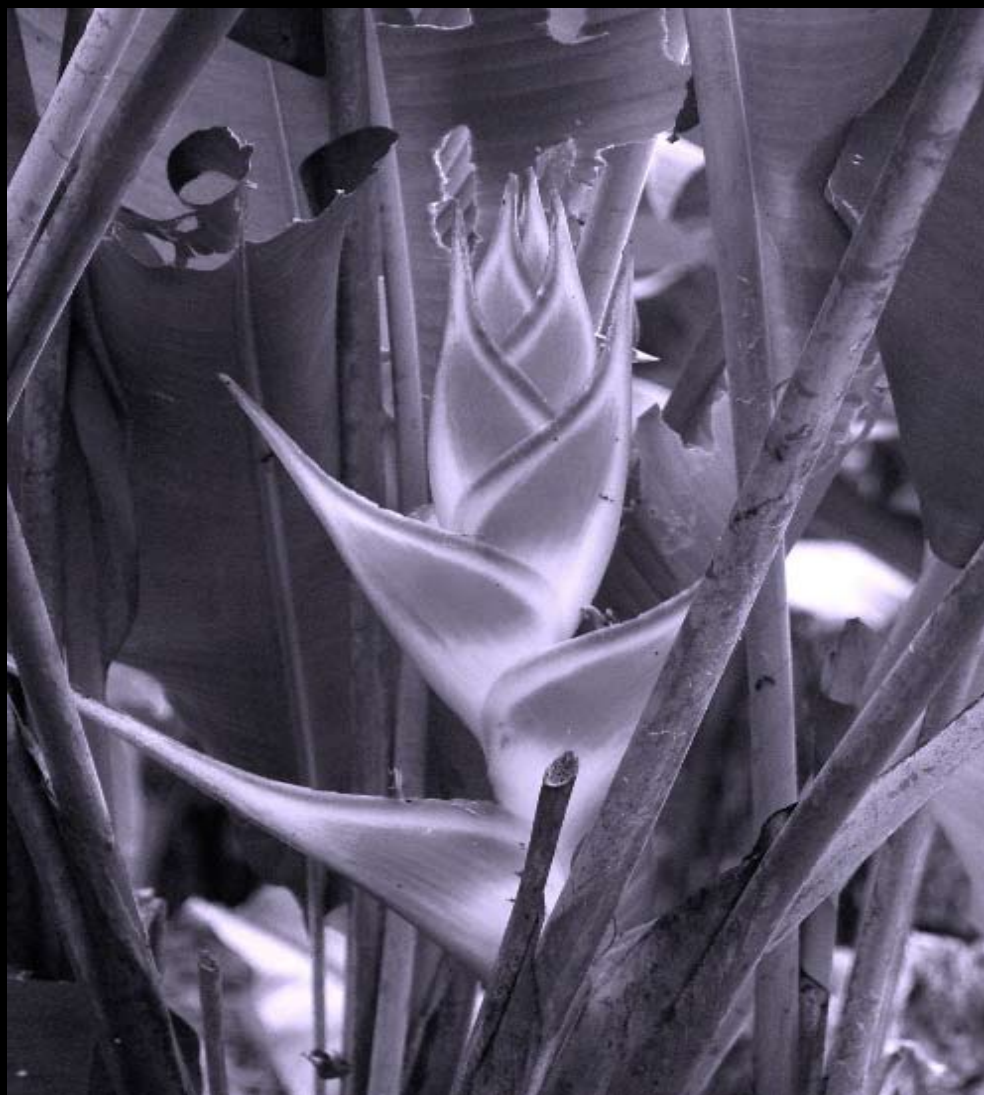
São Tomé (São Tomé e Príncipe)