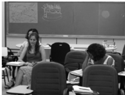
Figura 1. Momentos de concentração em “Visão do futuro de Palmas”.

A figura 3 reproduz alguns dos desenhos elaborados.