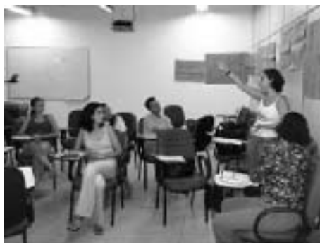
Figura 4. Debatendo visões de futuro.