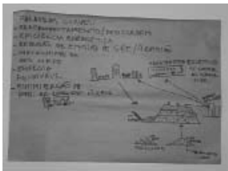
Figura 3. Alguns desenhos elaborados em "Visão do futuro de Palmas".