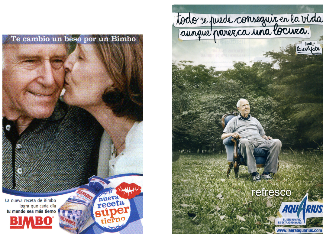
Figura 2. Anuncios utilizados

En la elección del medio a utilizar nos hemos decantado por el impreso al ser el más efectivo para dirigirse a las personas mayores ya que permite controlar mejor la información, tomarse el tiempo necesario para asimilarla, organizarla, seleccionar lo que le interesa, guardar los ejemplares e incluso transferirlos (Grande, 2000; Schewe, 2001; Garcillán y Grande, 2002).