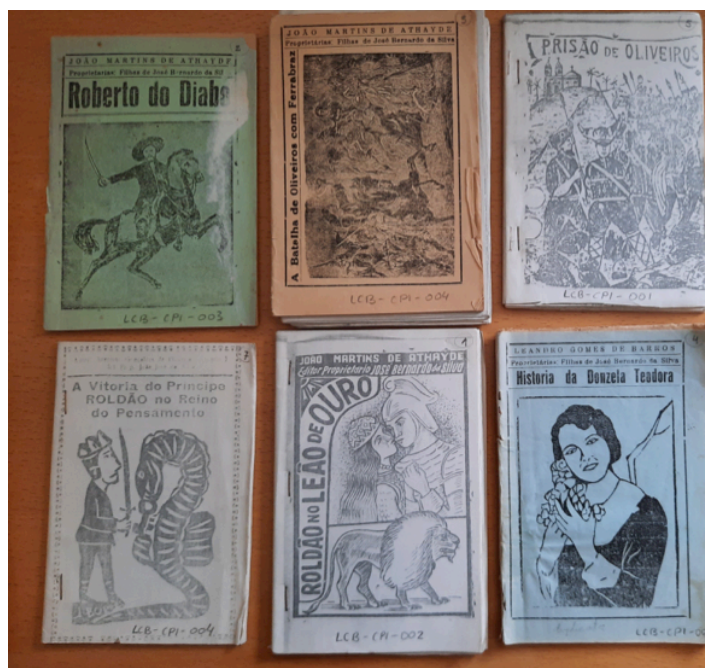
Fig. 2: Entre la colección de fotocopias se encuentran pliegos poéticos originales, edición contemporánea de literatura de cordel, existente todavía en Brasil, que permite constatar la pervivencia de historias y temas.

Hemos querido recordar los cimientos de los estudios de las relaciones de sucesos en que la profesora García de Enterría fue pionera y visionaria, pues se dio cuenta con clarividencia del potencial que estos pequeños productos de imprenta ofrecían (lo cual se ha demostrado con el tiempo) para estudios transversales y como muestra excepcional de la sociedad de su tiempo. El estudio de los pliegos de cordel en general, y de las relaciones de sucesos en particular, permite acceder a un universo cultural de gran calado.