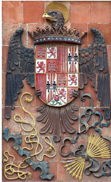
Fig. 1. Escudo de los Reyes Católicos en la Escuela de Artes de Toledo