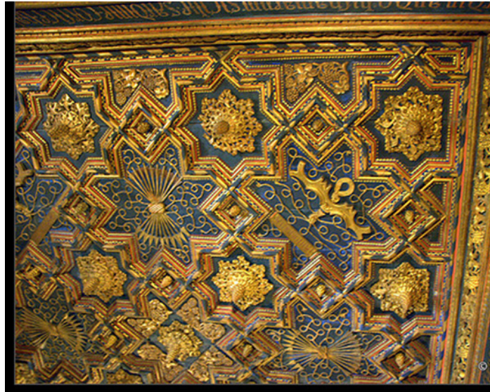
Fig. 5. Artesonados. Aljafería de Zaragoza, 1490