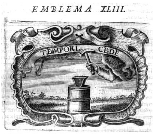
Fig. 12. Solórzano, Emblemata... (1653)