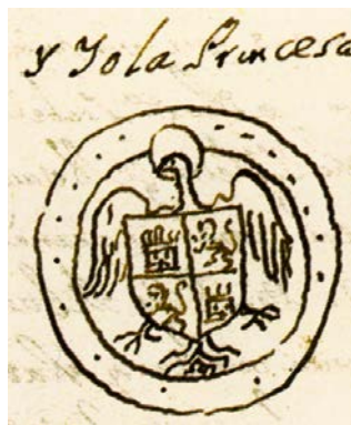
Fig. 13. Dibujo de Luis de Salazar y Castro del sello de la princesa Isabel