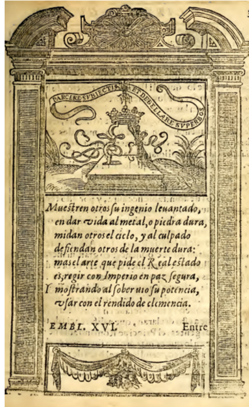
Fig. 11. Juan de Horozco. Emblemas morales (1589)