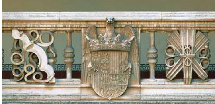
Fig. 9. San Juan de los Reyes. Toledo