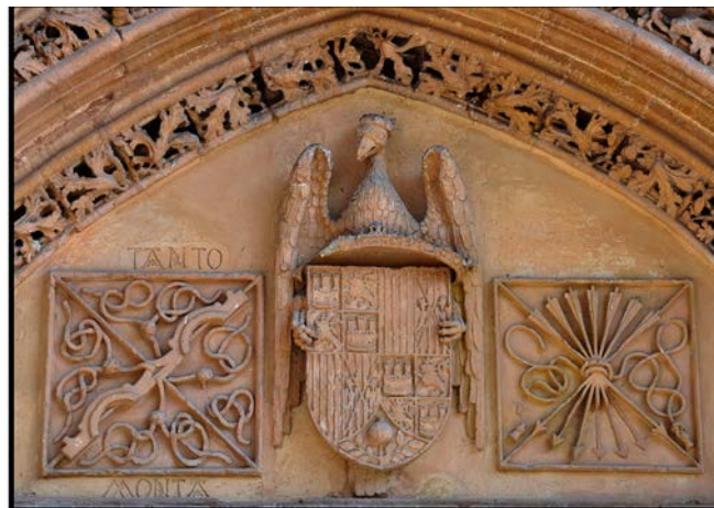
Fig. 2. Orihuela (Alicante), Iglesia de Santiago Apostol, detalle