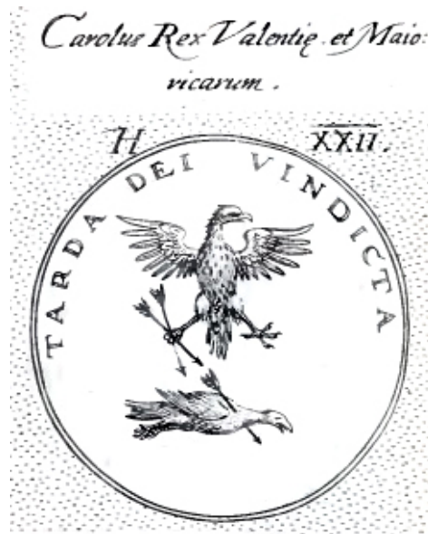
Fig. 15. Typotius, Symbola Divina & Humana