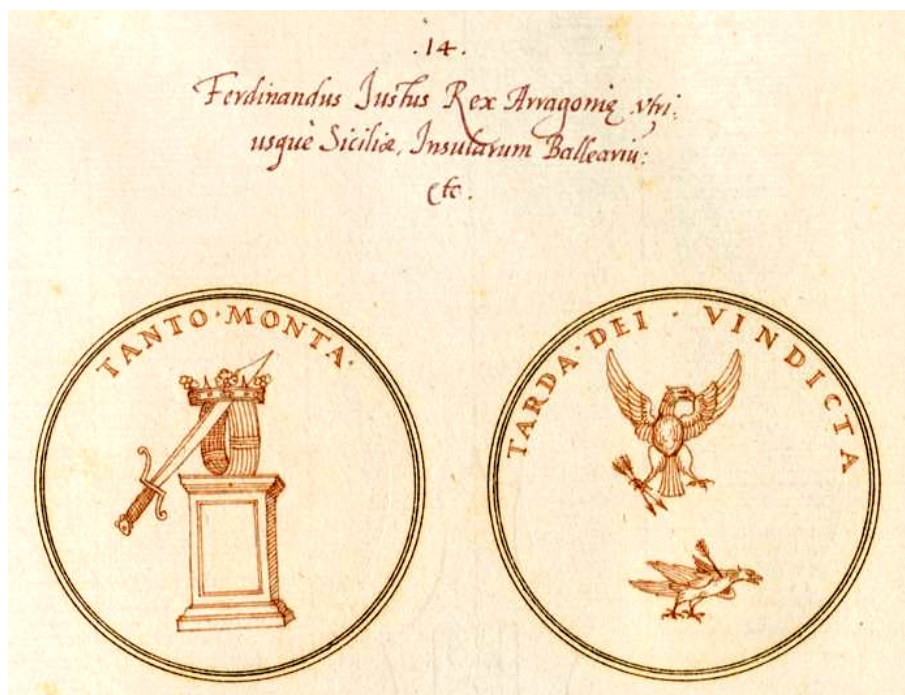
Fig. 8. Strada, Symbola Romanorum imperatorum...