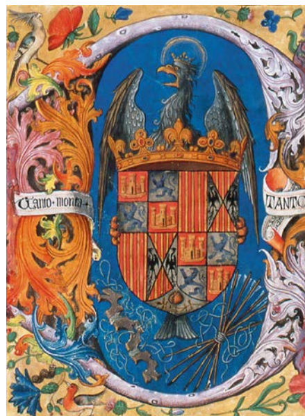
Fig. 16. Miniatura con el escudo de los Reyes Católicos tras la conquista de Granada