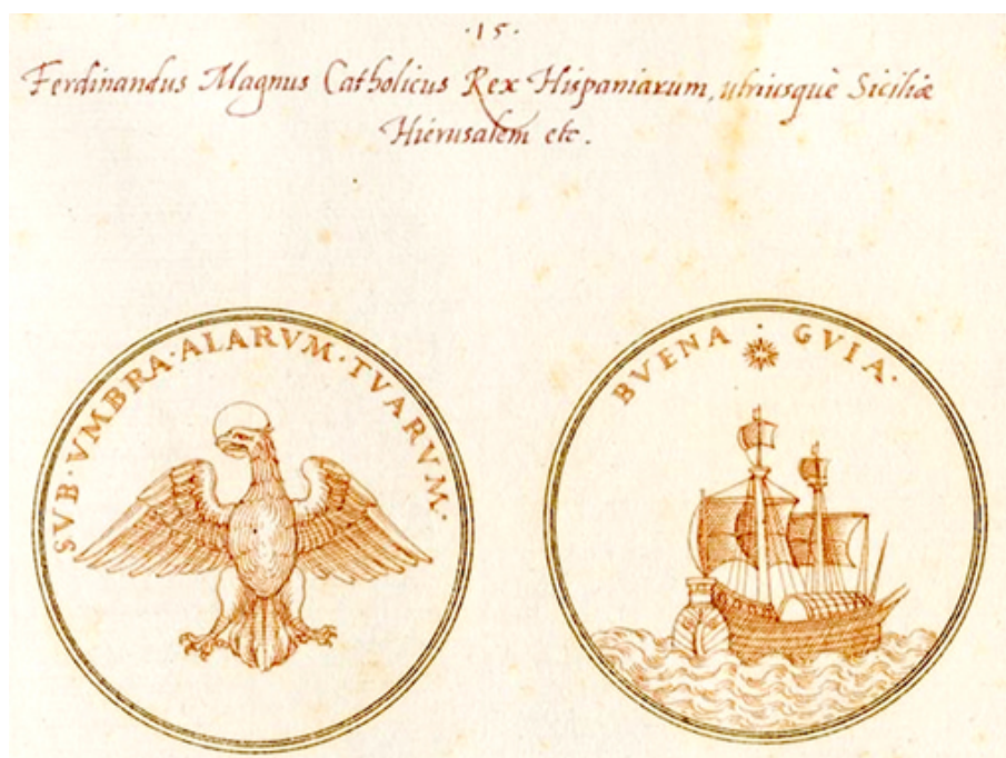
Fig. 14. Strada, Symbola Romanorum imperatorum