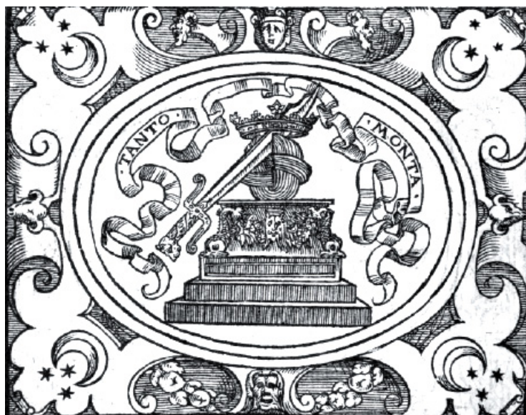
Fig. 6. Paolo Giovio, Empresa del rey Fernando el Católico. Traducción al castellano de Alonso de Ulloa, Lyon, Rovillé, 1561