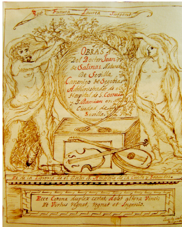
Fig.1. Real Academia Española, ms. RM-6946, portada

adorno floral y otros primores caligráficos, y el frontispicio precedente lleva debajo de la cartela inferior la firma inequívoca de que «Cuesta lo ideó y dibujó», en un errático latín abreviado que apunta a una falsa etimología: «Cuesta imb. et | deligneab.» 16 , si es que se debe desarrollar y corregir como «Cuesta inveniebat et delineabat». Estos descuidos ortográficos, que veremos abundar en el inventario que aquí doy a conocer, contrastan con el lema y el dístico elegíaco con que glosa de su propia minerva las figuras del frontispicio 17 .