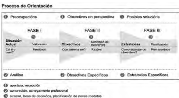
Figura 1. Proceso de Orientación Profesional nos Servizos de Emprego de Alemaña.

Na Figura 2, achégase o grado de experiencia en orientación internacional dos orientadores/as participantes.