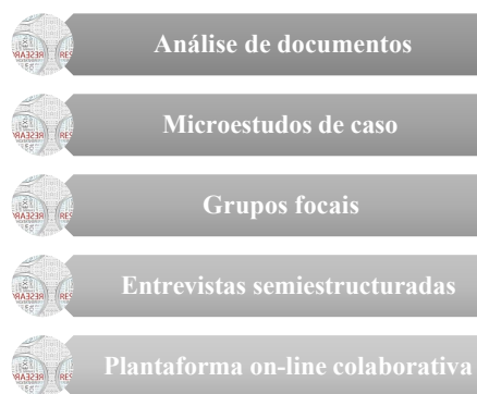
Gráfico 2. Técnicas utilizadas na investigación

5. Elaboración de forma colaborativa dunha plataforma dixital .