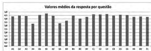
Figura 2. Valores médios da resposta por questão

Os questionários apresentam valores bastante altos na concordância em relação às questões colocadas (só 3 com valor médio < 4.0), como se pode ver na Figura 3. A correspondência entre os códigos das perguntas do gráfico e o respetivo texto pode ser vista na Figura 3.