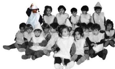
Figura 1. Soy la única marrón

Fui contenta... hasta que vi la foto. Fue la primera vez que me veía en una misma imagen con todo mi grupo de “iguales”. Y yo era diferente; la única marrón.