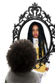
Figura 3. Espejito, Espejito