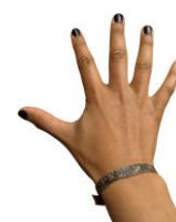
Figura 5. Ebebe