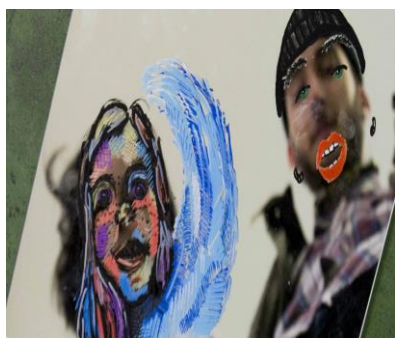
Figura 9. Autorretrato, intercambio y bautizo

- Representación de su autorretrato sobre un espejo de forma individual incluyendo las ideas sacadas del ejercicio anterior y utilizando las técnicas que se consideren más adecuadas. Los autorretratos merecen una atención particular en un momento tan importante como es la construcción del “yo” y maduración personal como es la adolescencia.