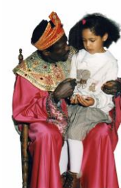
Figura 2. Nieta y abuelo