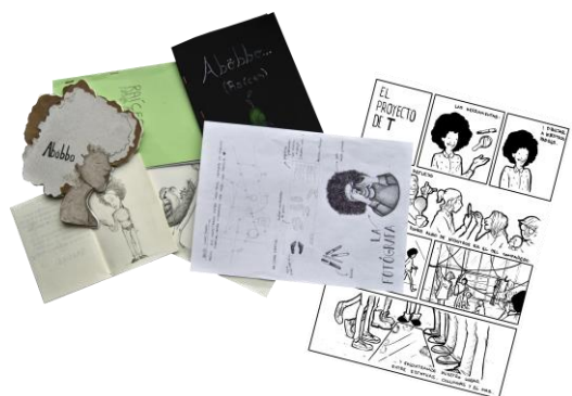
Figura 11. Memorias

enormemente con una maquetación muy original llevada en cada caso a su terreno, apareciendo desde textos con una estructura más común hasta cómics o ilustraciones. Mi silueta aparece en todos, referencias gráficas de mi presencia en la actividad. Se quedaron con datos míos personales en relación a mis raíces y a palabras en bubí que fueron apareciendo; sobre todo, el título de “abobbo” (orígenes en bubí). Todos los trabajos transmiten positivismo y agradecimiento, viendo la intervención como algo nuevo y diferente, que les ha hecho reflexionar.