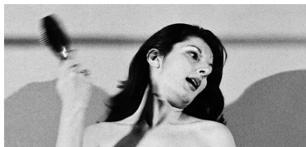
Figura 8. Art must be beautiful, Abramović

El análisis de la obra de artistas como Kara Walker, Virxilio Viéitez, Tracey Moffatt, Eva Koch, Lorna Simpson o Abramović, junto con toda la investigación anterior entorno a mi propia historia de vida, fueron el eje para la generación de las estrategias artísticas.