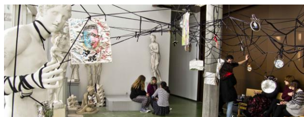
Figura 10. Instalación, la plaza del grupo

y los recorreremos juntos para quedarnos con un único espacio. Será un lugar común al colectivo, la plaza del grupo, un lugar de reunión. Y en él haremos una instalación hecha entre todos como elemento singular motor de cualquier grupo social. Estará formada por los espejos y una cuerda que nos conectará, simulando las relaciones entre unos y otros. Una experiencia conceptual en un ambiente determinado que representa la identidad colectiva del grupo. Una construcción en la que múltiples espejos autorretratados simbolizando el “yo” individual cuelgan de un espacio, apropiándose de él y generando colectividad.