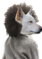
Figura 4. Can de palleiro

Llegué al mundo gracias a la unión de uno de Visantóna (Galicia, España) con una de Malabo (Isla de Bioko, Guinea Ecuatorial). Soy una cosa, soy la otra, ¿o soy las dos? En el entorno de la familia de mi padre soy la negra; en el de mi madre, la blanquiña. Mi pareja acabó por denominar mi no-raza “can de palleiro”: un pobre ser que nace sin pedigrí.