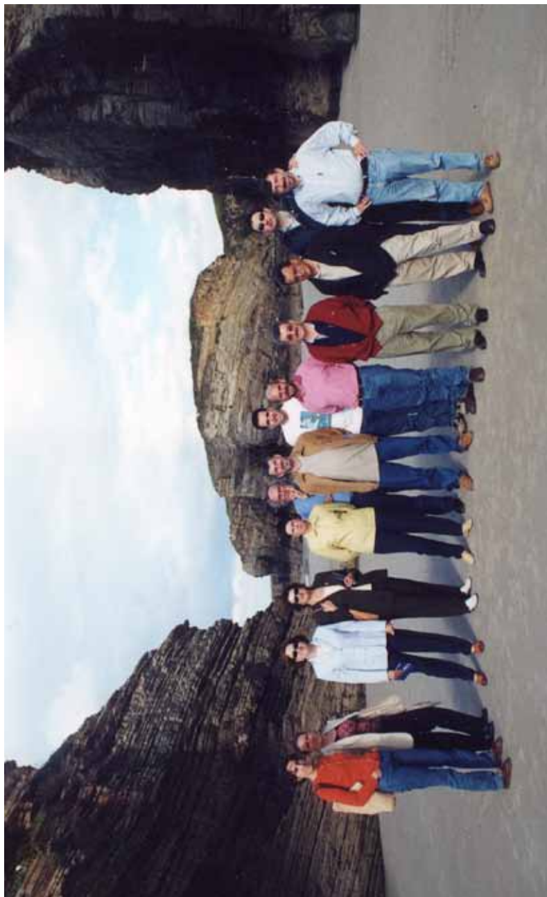
2001. Na praia das Catedrais. Aquel ano debéronse cruzar varios astros no ceo, pois nunca tantos nos moveramos para ir a un dos Coloquios bienais , convocados pola Sociedade Española de Historia de la Educación . Tocara en Oviedo e á volta houbo que vir pola Mariña, por "mandato" dun de nós coa infancia prendida naquelas terras cantábricas. Moi loada foi sempre esta foto. Sabemos que perdura no tempo.